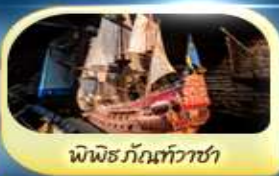
พิพิธภัณฑ์ทิวาซา