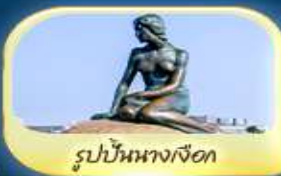
รูปปั้นนางเงือก