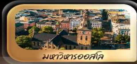
มหาวิหารออสโล