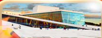
OSLO OPERA HOUSE