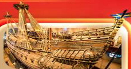
พิพิธภัณฑ์ท้าวชา