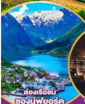
ส่องเรือชม ช่องน้ำพยอร์ด