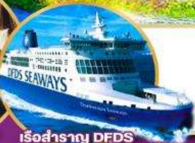
เรือสำราญ DFDS