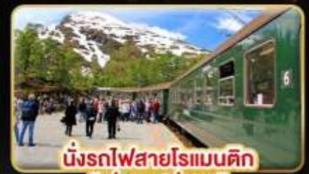
นั่งรถไฟสายโรแมนติก “ฟรอมสปาน่า”