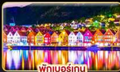
พักเบอร์กิน