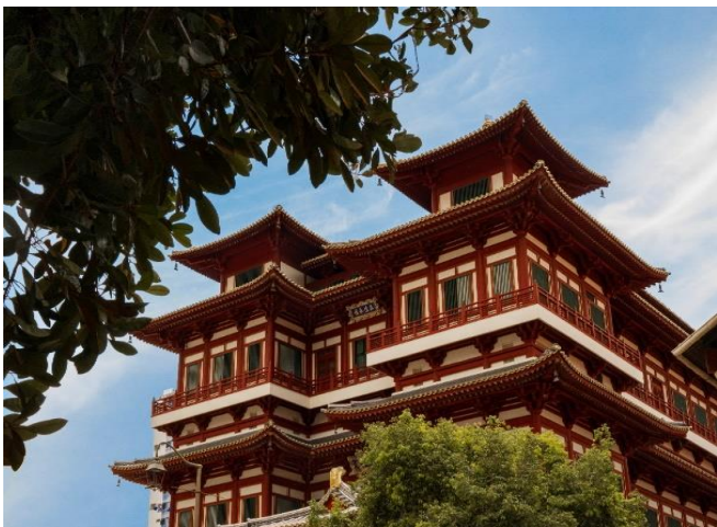
ประมาณ 1 ชม.

นำท่านเดินทางสู่ CHINATOWN ชมวัดพระเชี้ยวแก้ว (Buddha Tooth Relic Temple) สร้างขึ้นเพื่อเป็นที่ประดิษฐานพระเชี้ยวแก้ว ของพระพุทธเจ้า วัดพระพุทศศาสนาแห่งนี้สร้างสถาปัตยกรรม สมัยราชวงศ์ถัง วางศิลาฤกษ์ เมื่อวันที่ 1 มีนาคม 2005 ค่าใช้จ่ายในการก่อสร้างทั้งหมดราว 62 ล้านเหรียญสิงคโปร์ (ประมาณ 1500 ล้านบาท) ชั้นล่างเป็นห้องโถงใหญ่ใช้ประกอบศาสนพิธี ชั้น 2-3 เป็นพิพิธภัณฑ์และห้องหนังสือ ชั้น 4 เป็นที่ประดิษฐานพระเชี้ยวแก้ว (ห้ามถ่ายภาพ) ให้ท่านได้สักการะองค์เจ้าแม่กวนอิม และใกล้กันก็เป็นวัดแขกซึ่งมีศิลปกรรมการตกแต่งที่สวยงาม พร้อมเดินเล่นช้อปปิ้ง ชื่อของที่ระลึกตามอัธยาศัย