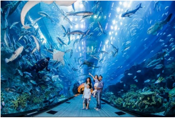
ของทะเลต่างๆ ทั่วโลก