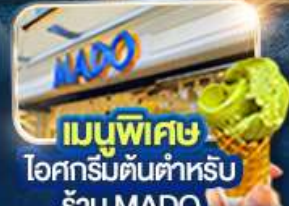
เมนูพิเศษ ไอศกรีมต้นตำหรับ ร้าน MADO