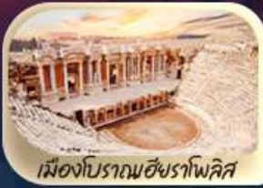
เมืองโบราณเฮียราโพลิส