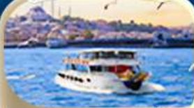
ช่องแคบบอสฟอรัส