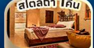
คัปปาโดเกีย