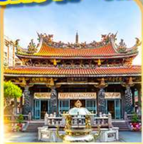
วัดหลงชาน