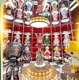
POP MART ซีเหมินติง