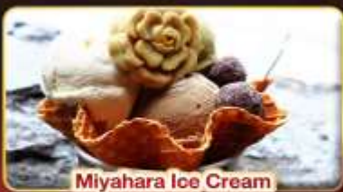
Miyahara Ice Cream

มหานครแห่งเมืองสี่สี "ไทเป" ช้อปปิ้งจุใจ 3 ตลาดกลางคืนชื่อดัง