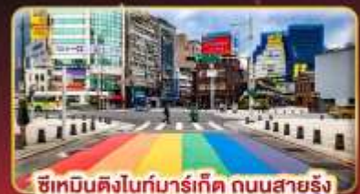
ซีเหมินติงไนท์มาร์เก็ต ถนนสายรุ้ง