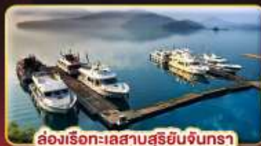
ล่องเรือทะเลสาบสุริยัมจินตรา