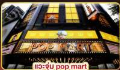
แวะจับ pop mart ที่ซื้อมากที่สุดในซีเหมินติง

ช้อปปิ้งจุใจ..ตลาดซีเหมินติง ตลาดโกจ้งไนท์มาร์เก็ต ตลาดเหลาหออไบท์มาร์เก็ต