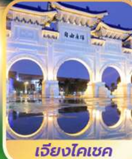
เจียงโคเชค