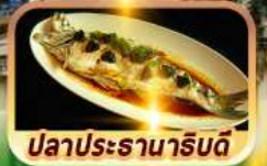
ปลาประจานารับดี