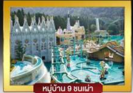
หมู่บ้าน 9 ชนเผ่า