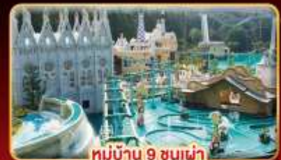
หมู่บ้าน 9 ชนเผ่า