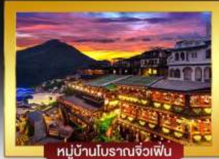
หมู่บ้านโบราณจิวเฟิน