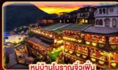
หมู่บ้านโบราณจิวเฟิน