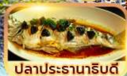
ปลาประรานาธิบดี