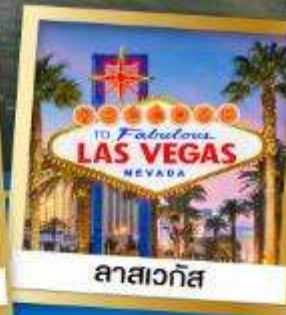
ลาสเวกัส