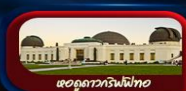
หอดูดาวกริฟฟิท

การันตี 10 ท่านออกเดินทาง พร้อมหัวหน้าทัวร์คนไทย