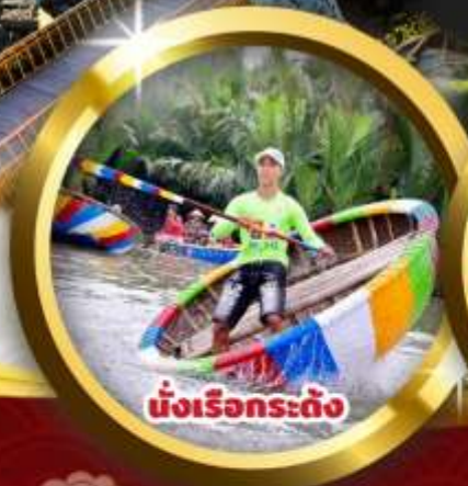
นั่งเรือกระดง