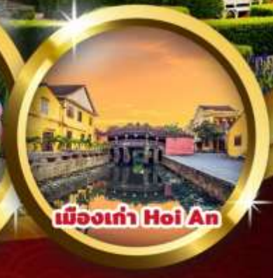
เมืองเก่า Hoi An