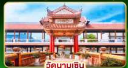
วัดนามเชิน