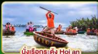
นั่งเรือระดิง Hoi an