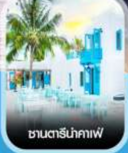
ซานตารีน่าคาเฟ่