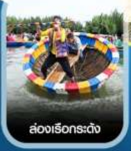
ล้องเรือกระดัง

✈️ คอนเฟิร์มออกเดินทาง ทุกพีเรียด 2 ท่านขึ้นไป