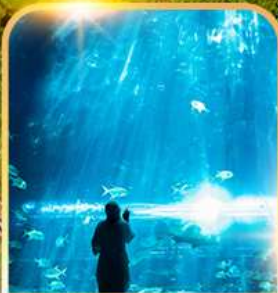
อควาเรียม