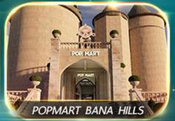
POP MART BANA HILLS

สัมผัสความงามหมู่บ้านฝรั่งเศสที่บานาฮิลล์ ช้อปปิ้ง POPMART