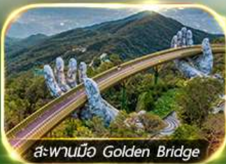
สะพานมือ Golden Bridge