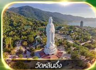
วัดหลินอึ้ง